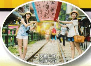
天燈上げ(イメージ)