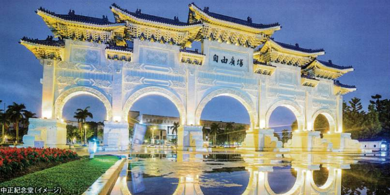
中正紀念堂(イメージ)