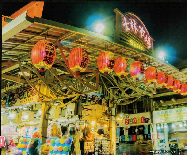
士林夜市(イメージ)

TOUR POINT 5 追加代金で参加可能!! 観光プランもご用意 台北市内観光はもちろん 人気の九份・十分観光プランをご用意!!