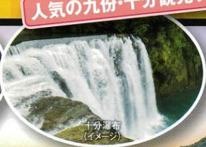
十分瀑布(イメージ)