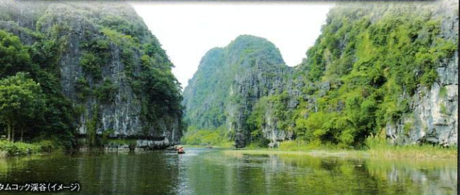
サムコック渓谷 (イメージ)