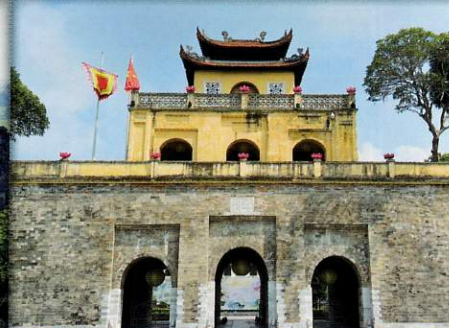
タンロン城 (イメージ)