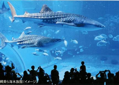
美麗ら海水族館 (イメージ)