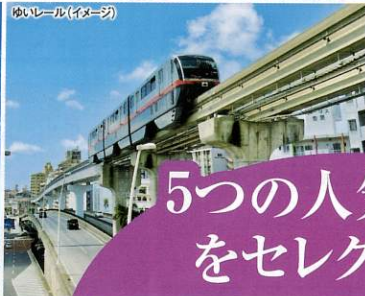
ゆいレール (イメージ)