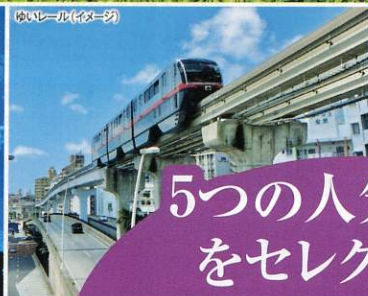
ゆいレール(イメージ)