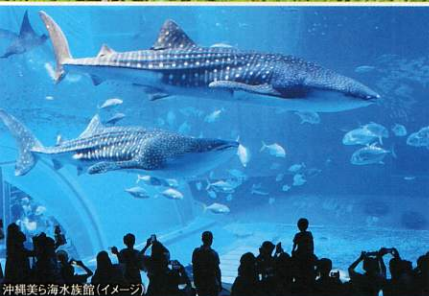
沖縄美ら海水族館(イメージ)