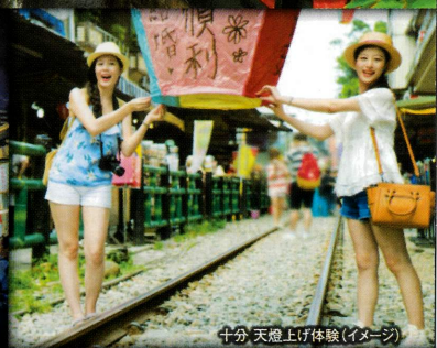
十分 天燈上げ体験(イメージ)