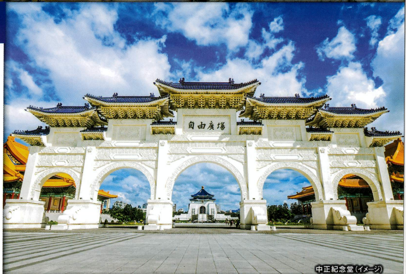
中正紀念堂(イメージ)

TOUR POINT 3 追加代金で 台北 十分 九份 などを満喫 参加可能! 日本申込/日本払い 観光券 もご用意!!