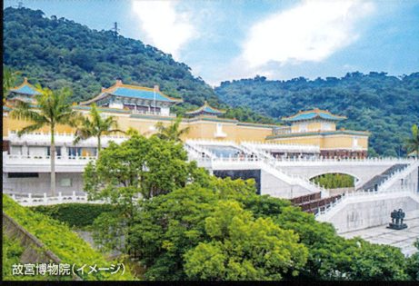
故宮博物院(イメージ)