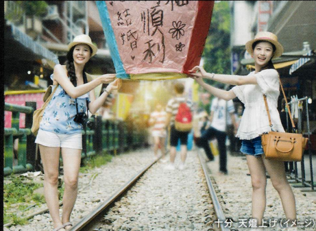
十分 天燈上げ(イメージ)