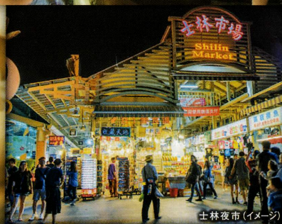
士林夜市(イメージ)