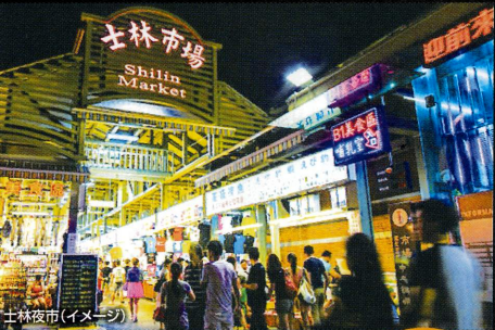
士林夜市(イメージ)