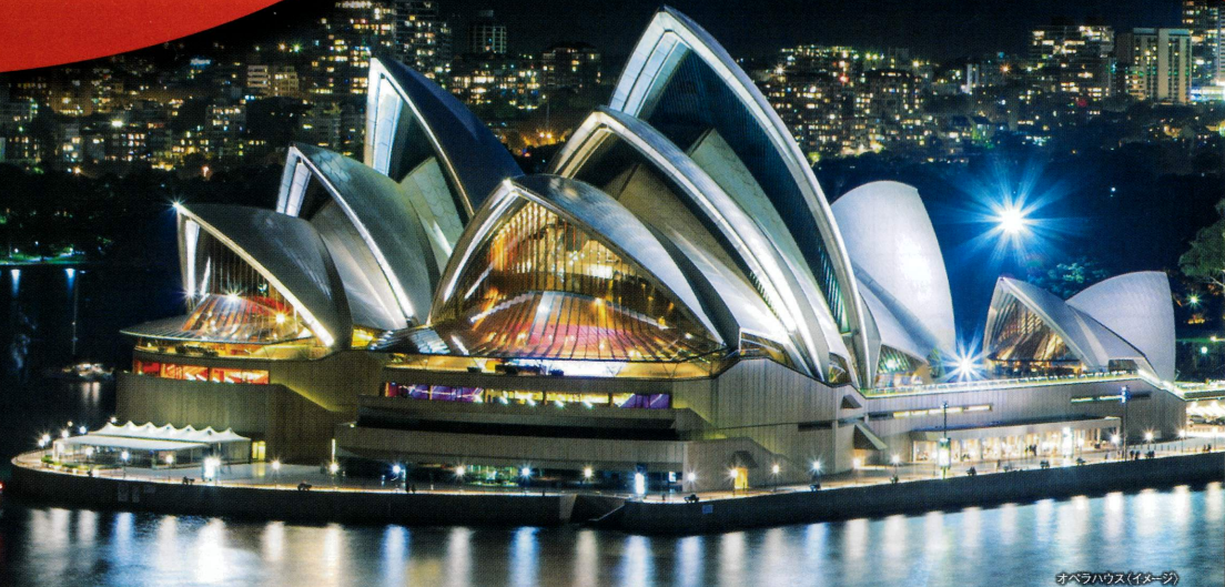
オペラハウス(イメージ)