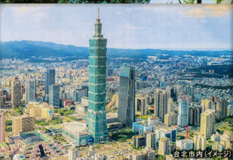
台北市内(イメージ)