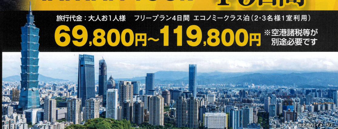
台北市内(イメージ)