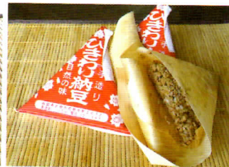
最近では珍しい経木を使用。香りと味わいが違います。