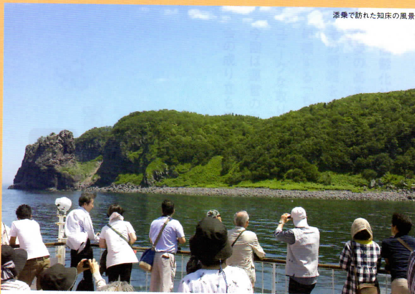
添乗で訪れた知床の風景